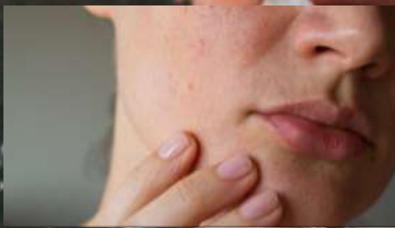
使用了刺激性 化学物质保养品